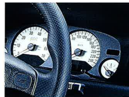
Alles im Blick: weiß unterlegte Instrumente.

Das 16V-ECOTEC®-Turbotriebwerk signalisiert mit der blauen OPC-