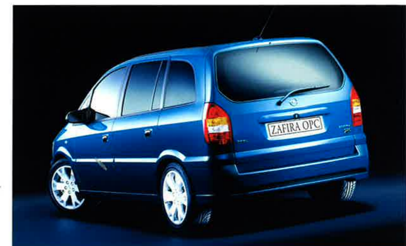
Zeichen gesetzt: Stoßfänger und Seitenschweller in Wagenfarbe, Türgriffe verchromt.