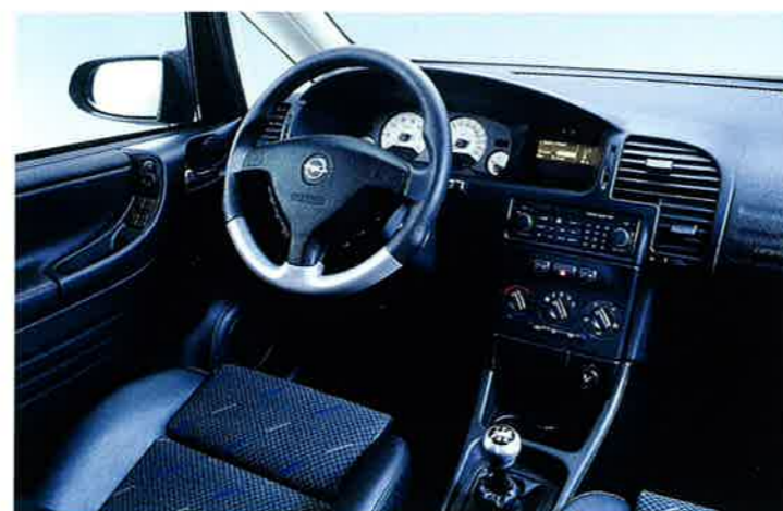
Alles im Griff: OPC-Sport-Lederlenkrad, Aluminium-Schalthebelknopf. Stereo-CD-Radio NCDR 1100 mit integriertem Navigationssystem ist Sonderausstattung.

Dieser Zafira macht eine gute Figur. Jeder Zentimeter seiner Linienführung signalisiert Leistungsbereitschaft und Dynamik – und doch bleibt das Zafira Topmodell optisch dezent. Die richtige Mischung eben für Automobil-Ästheten. Und mit seinem 141 kW (192 PS) starken 2,0-Liter-ECOTEC®-Turbotriebwerk bietet er genau die Leistungsreserven, um sportliche Dynamik und souveräne Gelassenheit in Einklang zu bringen. Die umfangreiche Ausstattung setzt diesen Eindruck auch im Innenraum fort: ein perfektes Ambiente für ambitionierte und anspruchsvolle Fahrer.