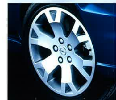
Exklusiver Look: 17-Zoll-Leichtmetallräder im OPC-Design.

Entdecken Sie Ihre Leidenschaft am Fahren neu: Testen Sie das exklusive und sportliche Topmodell – den Zafira OPC – bei Ihrem Opel Partner.