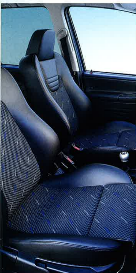
Perfektion im Detail: OPC-Sportsitze (Recaro) vorn, mit integrierten Seitenairbags und aktiven Kopfstützen. In Stoff-Leder-Kombination. Türverkleidung in Leder.

Dieser Zafira macht eine gute Figur. Jeder Zentimeter seiner Linienführung signalisiert Leistungsbereitschaft und Dynamik – und doch bleibt das Zafira Topmodell optisch dezent. Die richtige Mischung eben für Automobil-Ästheten. Und mit seinem 141 kW (192 PS) starken 2,0-Liter-ECOTEC®-Turbotriebwerk bietet er genau die Leistungsreserven, um sportliche Dynamik und souveräne Gelassenheit in Einklang zu bringen. Die umfangreiche Ausstattung setzt diesen Eindruck auch im Innenraum fort: ein perfektes Ambiente für ambitionierte und anspruchsvolle Fahrer.