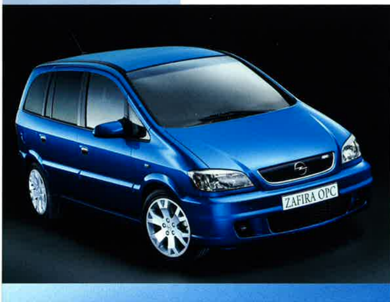
Markanter Auftritt: Stoßfänger vorn und hinten, Seitenschweller und Seitenschutzleisten in Wagenfarbe. OPC-Kühlergrill.