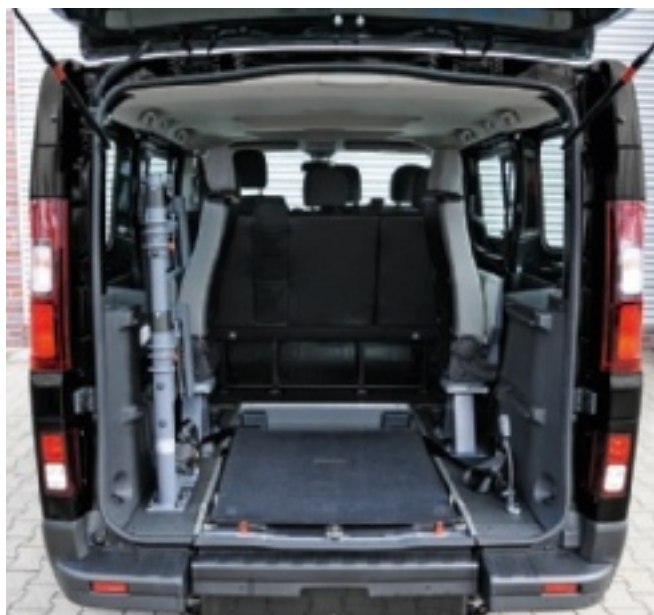
Mit der optionalen EasyFlex Rampe kann der Kofferraum voll genutzt werden