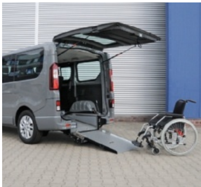
Bei ausgeklappter Rampe kann das Fahrzeug bequem mit dem Rollstuhl befahren werden