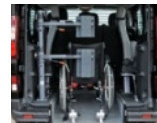
Fahrzeug mit optionaler Kopf- und Rückenstütze FutureSafe

Hinweis: Abbildungen zeigen Doppelbank vorn; ein Sitzplatz weniger bei Einzelbeifahrer.