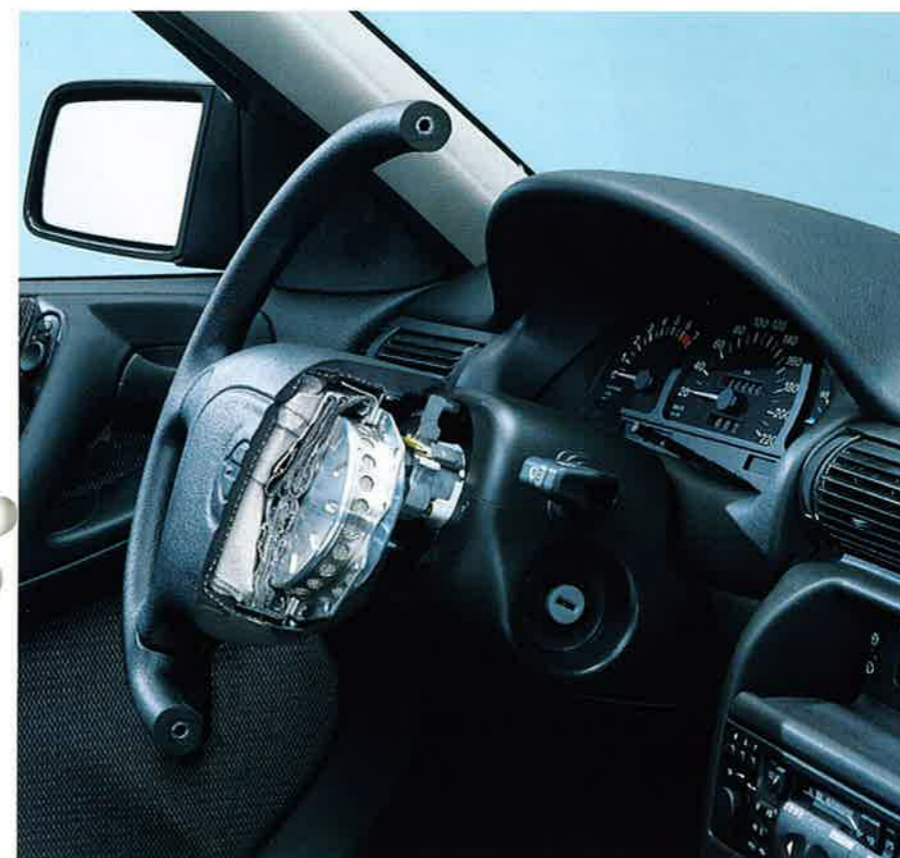
Der zusammengefaltete Airbag im Pralltopf des Lenkrades.

Der Opel Full Size Airbag ist voraussichtlich ab März 1993 für alle Astra-Modelle auf Wunsch, gegen Mehrpreis lieferbar.