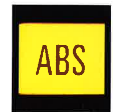
Serienmäßig in der Astra Limousine CD: ABS, das elektronische Anti-Blockier-System.

Die Astra Limousine CD ist der Beweis: Ein Höchstmaß an aktiver und passiver Sicherheit, Komfort und Platz ist kein Privileg der Luxusklasse mehr.