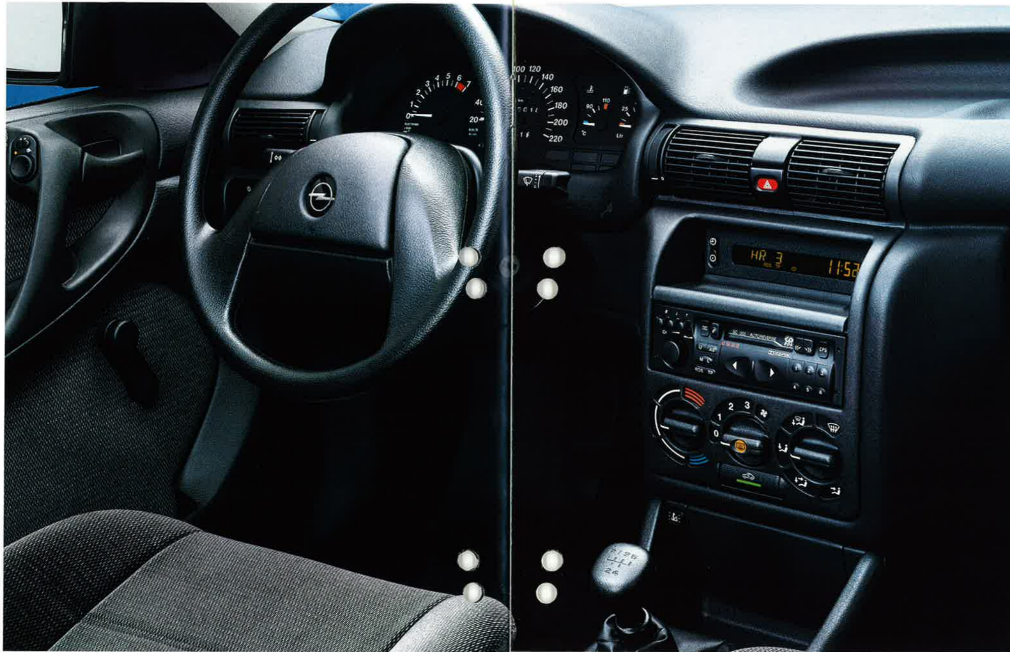
Die Servolenkung - serienmäßig in den Astra Limousinen CD, GLS und ab 1.6i-Motor im GL.

Das ergonomisch gestaltete Cockpit sorgt dafür, daß Sie das Verkehrsgeschehen jederzeit sicher im Blick und im Griff haben. Mit dem serienmäßigen Drehzahlmesser müssen Sie nicht länger nach Gehör fahren, um den jeweils günstigsten Drehzahlbereich auszunutzen.