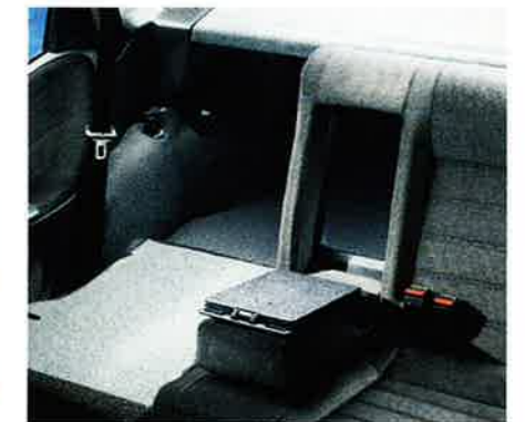
Die asymmetrisch geteilte, umklappbare Rücksitzbank mit Mittelarmlehne und Durchladeeinrichtung ermöglicht eine variable Ladefläche.

Die Astra Limousine beweist überzeugend, daß Komfort, Platz und Sicherheit nicht länger ausschließliche Erkennungsmerkmale der Luxusklasse sind.