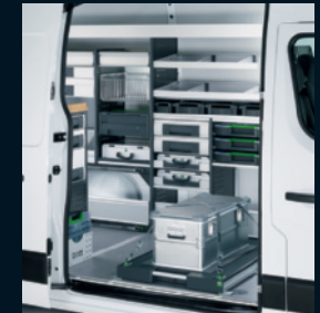
Stauraumorganisation für Montagefahrzeuge

Irrtum vorbehalten. Abbildungen können Sonderausstattungen enthalten. Stand: September 2014