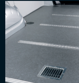
Wand- und Bodenverkleidungen mit Ladungssicherungselementen für den Lieferservice