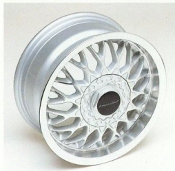
LM-Felge im Irmischer Kreuzspeichen-Design.