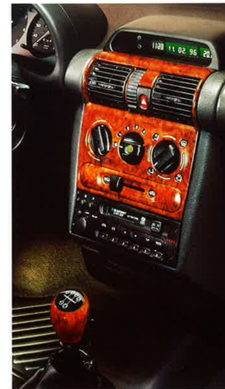
Interieurdekorsatz im Wurzelholz-Look i 19 17 010 und dazu passender Schalthebelknopf i 95 17 367.