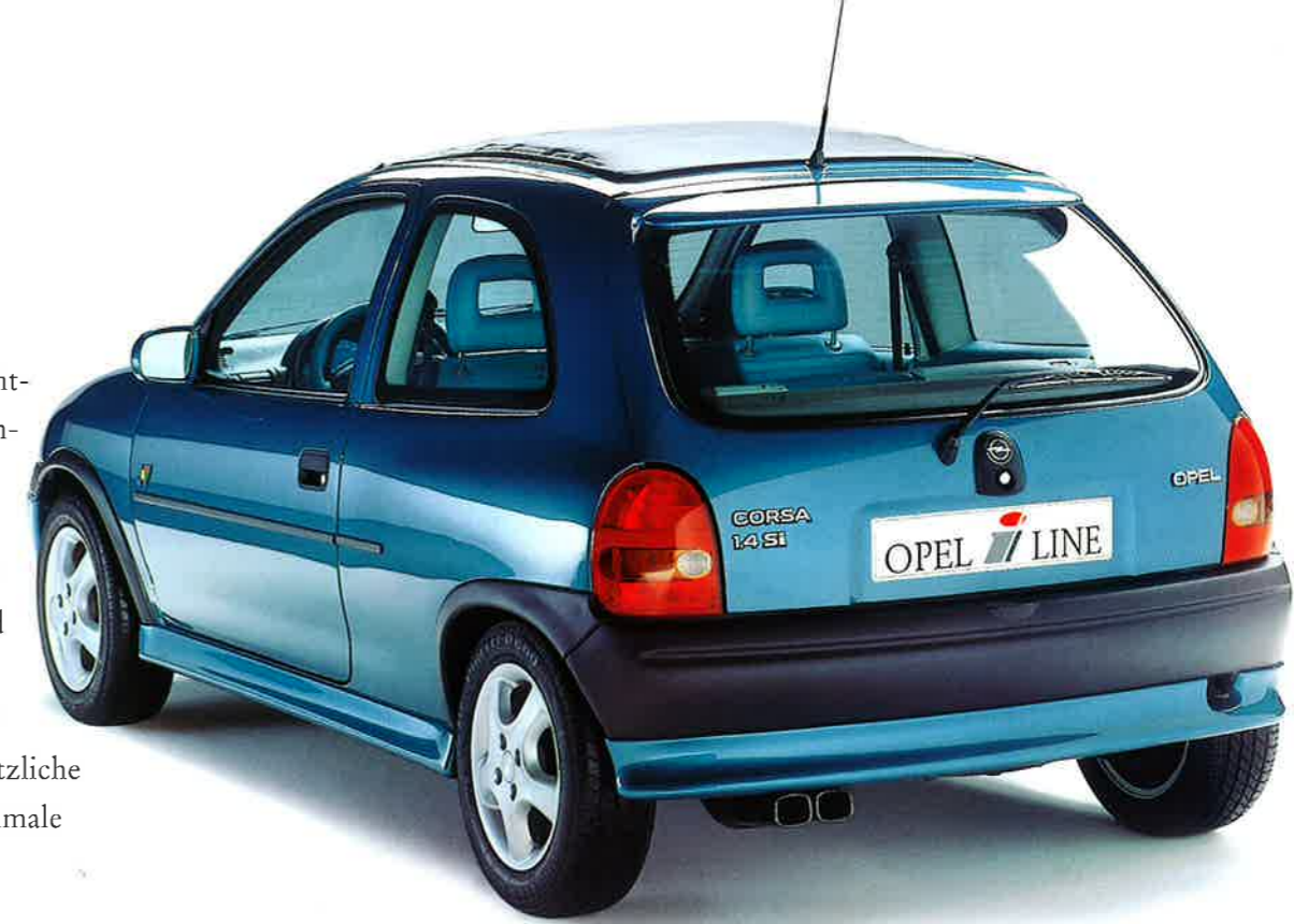
Dachspoiler i 12 01 448, Heckschürze i 12 01 451, Einstiegleistensatz i 12 01 302.

Kompromißlose Qualität, Paßgenauigkeit und TÜV-Gutachten bzw. ABE zeichnen das gesamte OPEL i LINE Zubehör aus.