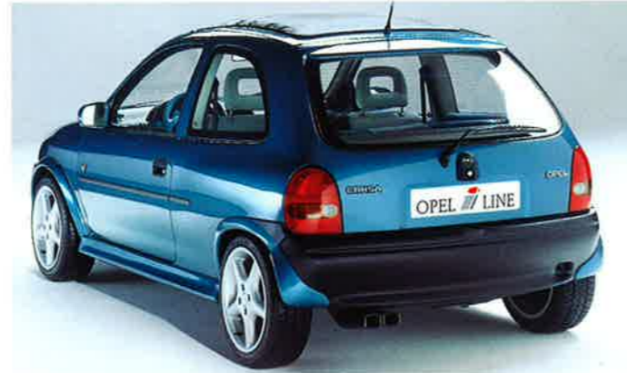
Dachspoiler i 12 01 448, Radabdeckung hinten i 12 01 455/456, Einstiegleistensatz i 12 01 302.