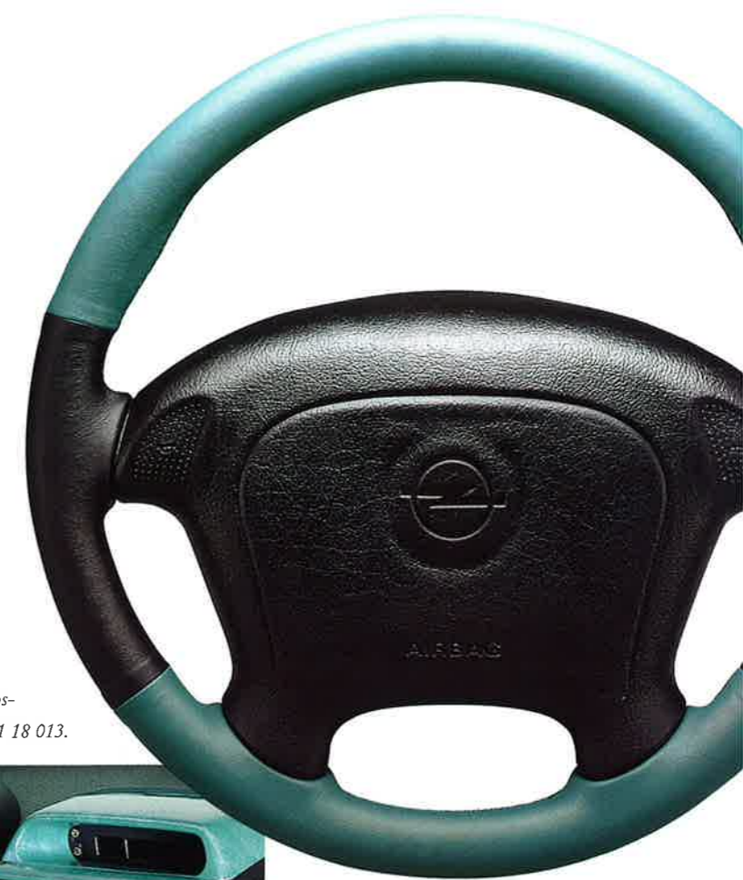
Lederlenkrad- kranz in barbados- grün/schwarz i 71 18 013.

Interieurdekorsätze im klassischen Wurzelholz- oder sportiven Carbon-Look geben dem Innenraum des Fahrzeuges einen ganz persönlichen Stil. Die pfiffigen Interieurteile im Graffiti-Design lassen sich perfekt mit dem Lenkradkranz in barbadosgrün/schwarz kombinieren und verleihen dem Fahrzeug ein jugendliches Innenleben.