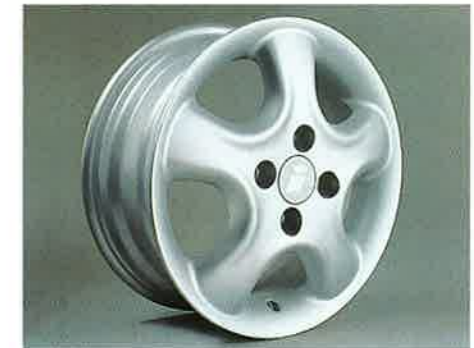
Softstern- oder ...

TÜV-geprüfte Qualität: Ein OPEL i LINE Komplettfahrwerk verbessert Spurtreue und Kurvenverhalten und bietet somit mehr Sicherheit.