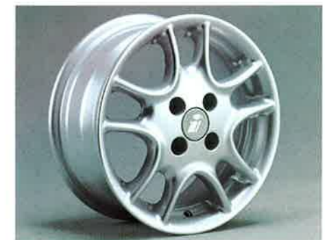
... Twin Spoke-Design: Zwei exklusive Leichtmetallräder in verschiedenen Größen stehen Ihnen zur Auswahl.