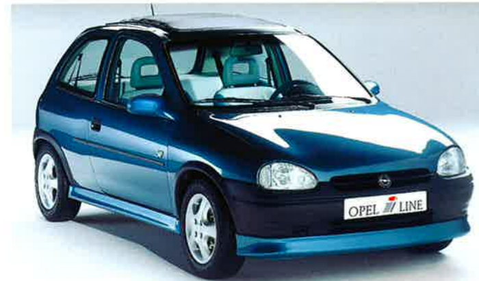
Frontspoiler i 12 01 001, Einstiegleistensatz i 12 01 302.

Zur Gewährleistung der hohen Ansprüche an Produktqualität und Verarbeitung setzt die Irmscher Firmengruppe ein ausgefeiltes Qualitätsmanagement-System ein. Mit der Verleihung des ISO 9001-Zertifikates durch die DEKRA wurde dessen Wirksamkeit bescheinigt.