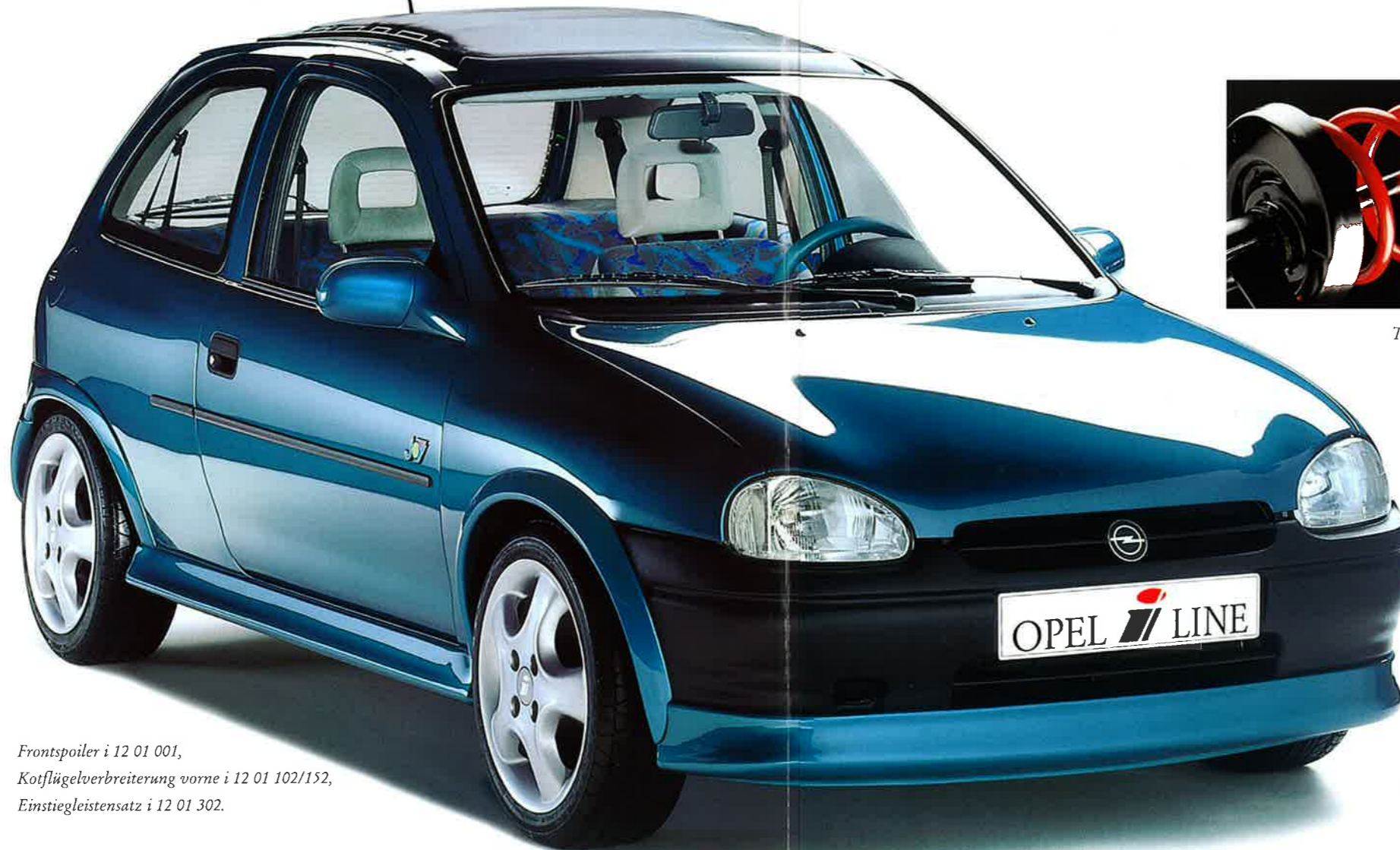
Frontspoiler i 12 01 001, Kotflügelverbreiterung vorne i 12 01 102/152, Einstiegleistensatz i 12 01 302.