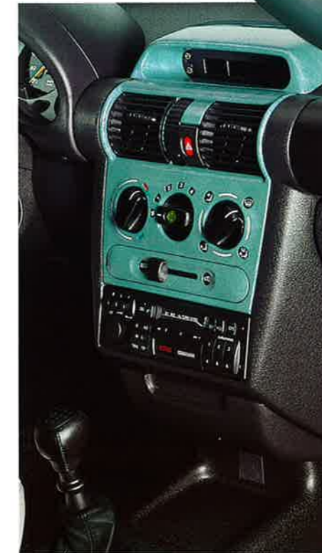
Interieurdekorsatz im Graffiti-Design i 19 17 001 bestehend aus Blende für Heizungs-/Lüftungsbereich und Radioanzeige.