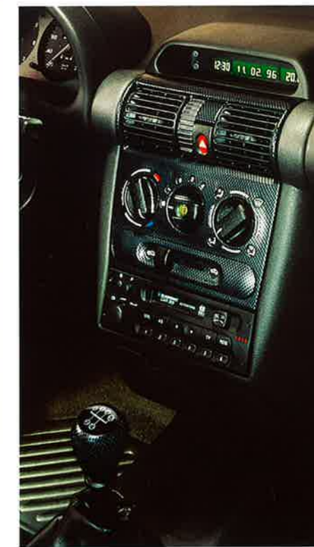
Interieurdekorsatz im Carbon-Look i 19 17 011 und dazu passender Schalthebelknopf i 95 17 364.