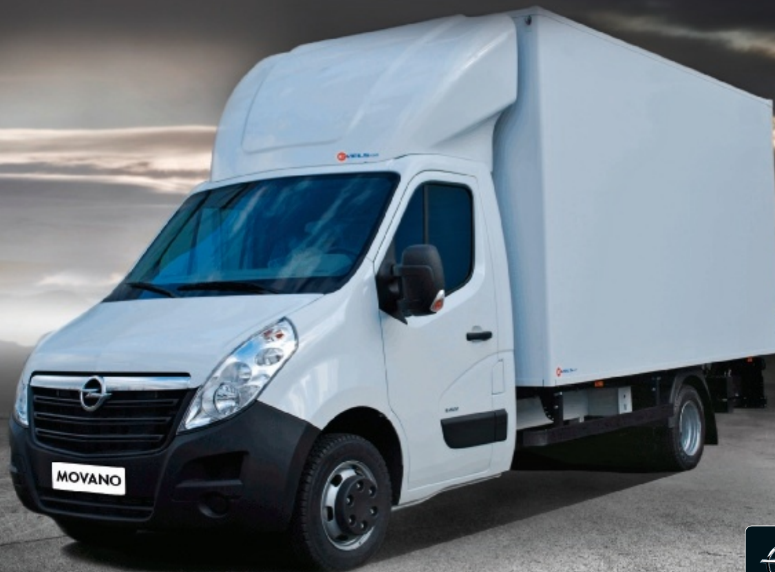
Abb. zeigt Sonderausstattungen.