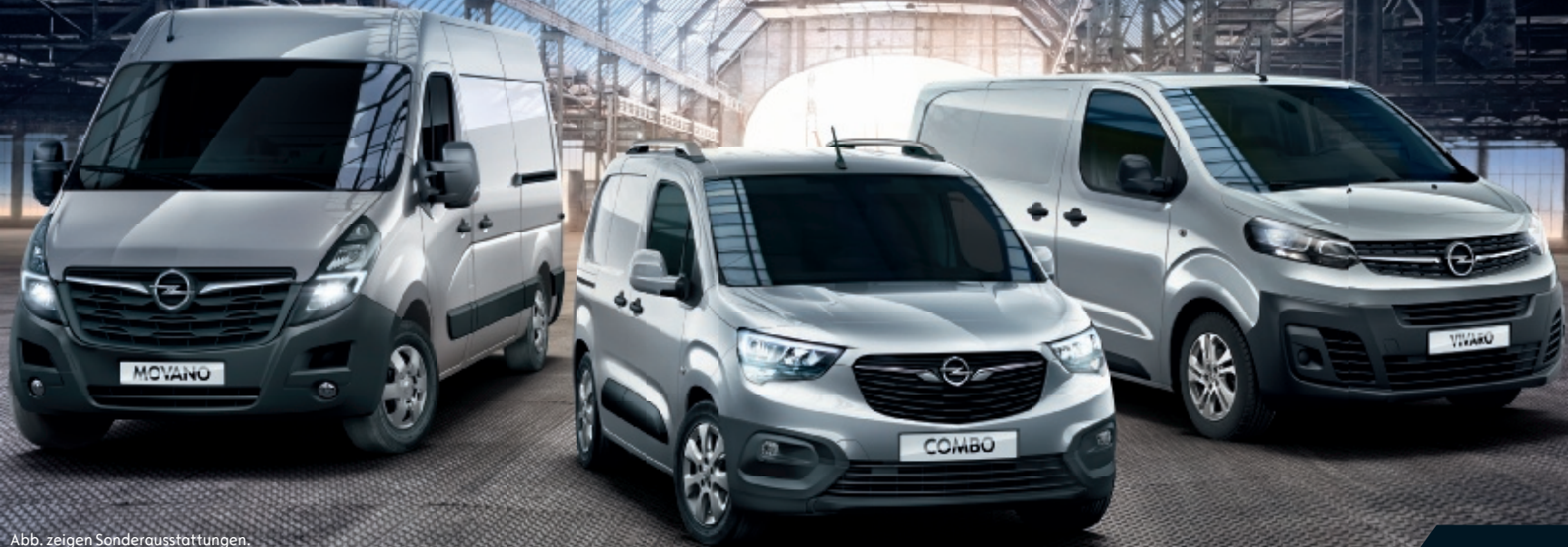
Abb. zeigen Sonderausstattungen.