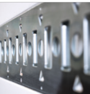
Integrierte oder aufgesetzte Zurrleisten (optional)