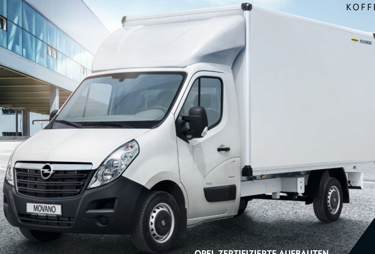
Abb. zeigt Sonderausstattungen.