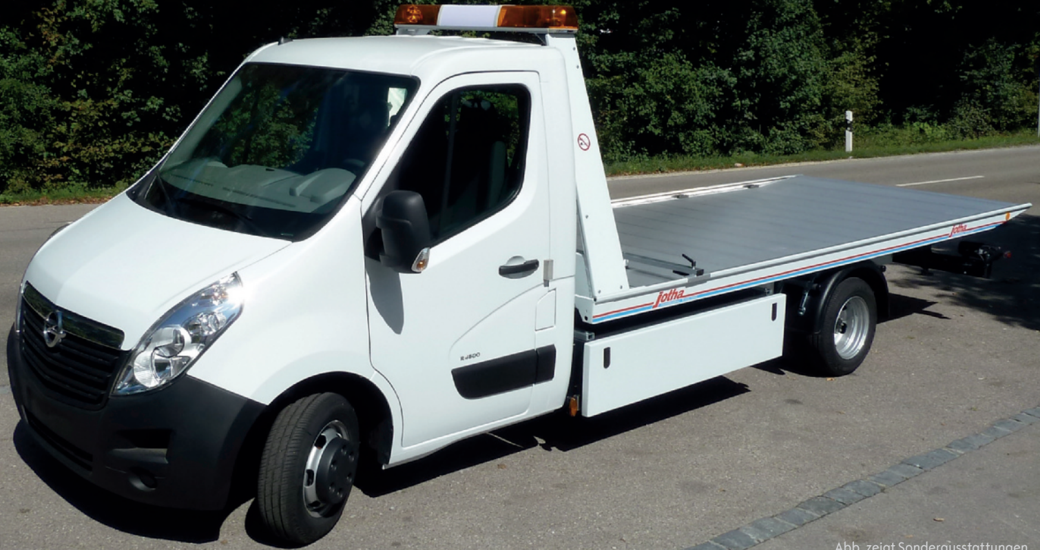
Abb. zeigt Sonderausstattungen.