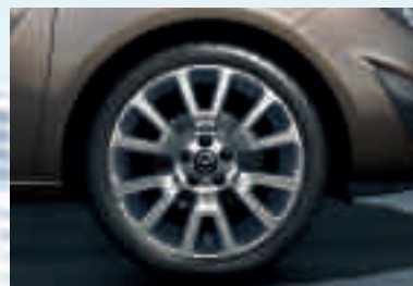
7 BiColor-Leichtmetallrad 7½ J x 18 im 6-Trapezspeichen-Design, Reifen 225/40 R 18