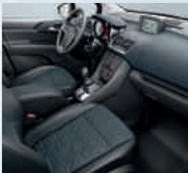
INNOVATION: Astor, Galvano Dunkelgrau/Morrocana 1 , Schwarz