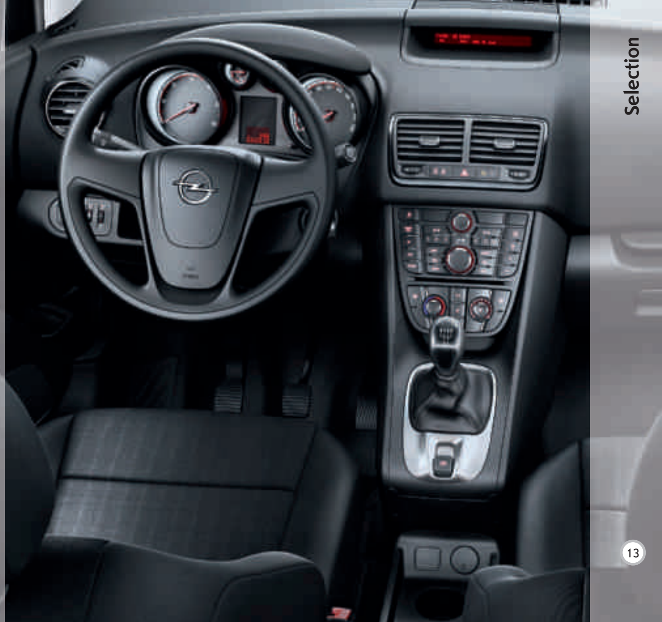
Abbildung zeigt Sonderausstattung.