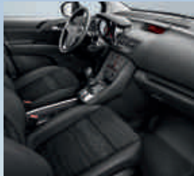
Edition: Skyline/Atlantis, Schwarz