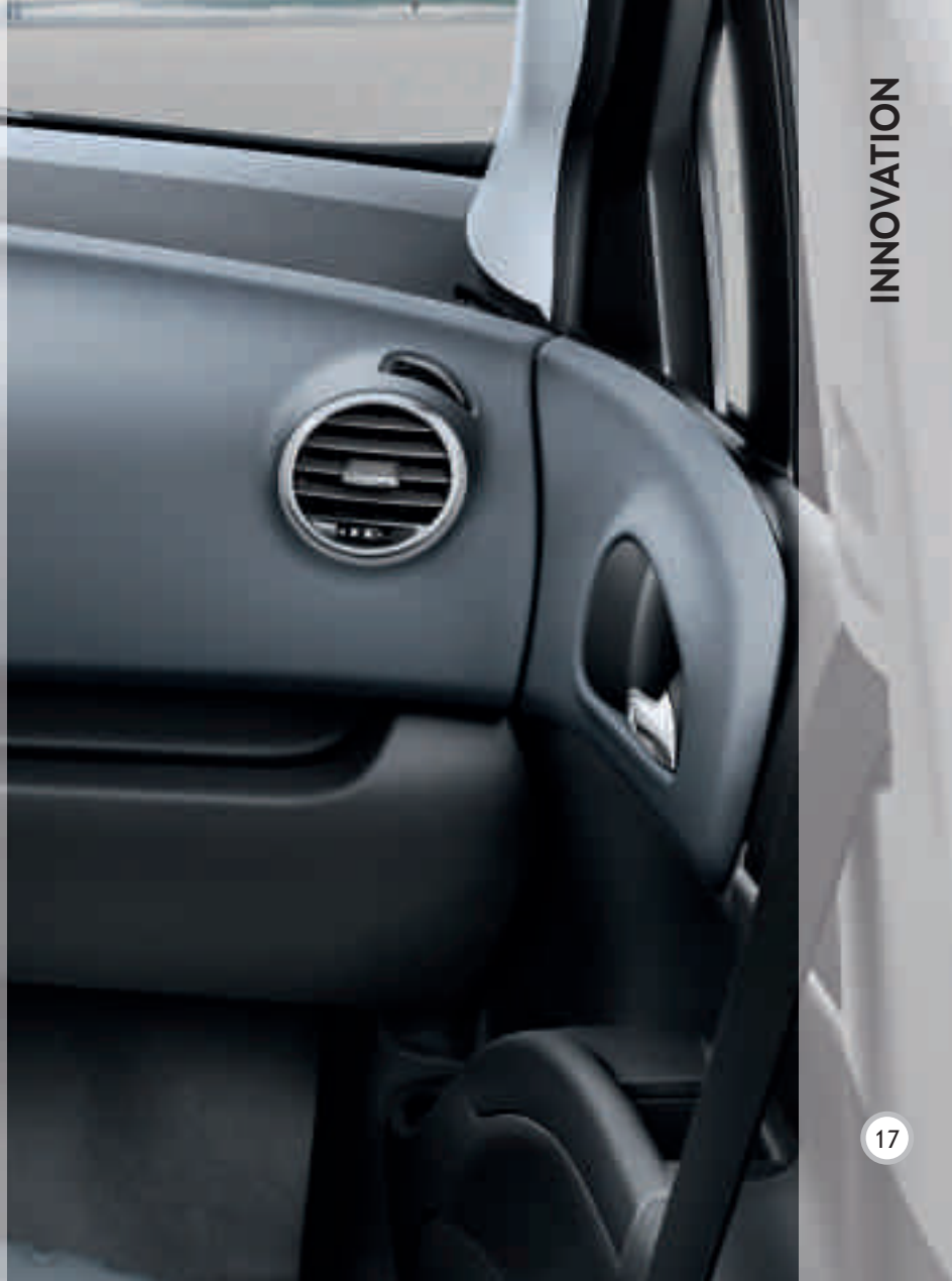
Abbildung zeigt Sonderausstattung.