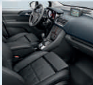
Ergonomiesitz mit Gütesiegel AGR: Leder 2 Mondial, Schwarz