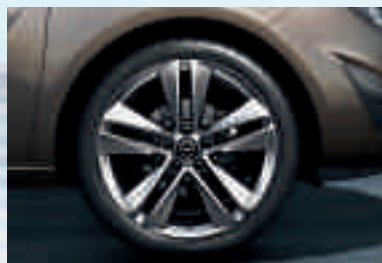
6 Leichtmetallrad 7½ J x 18 im 5-Doppelspeichen-Design, Reifen 225/40 R 18