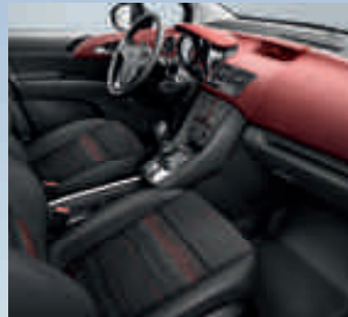
Edition: Skyline, Rot/Atlantis, Schwarz