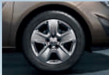
2 Designrad 6½ J x 16 im 5-Speichen-Design, Reifen 205/55 R 16