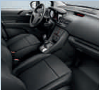
Selection: Pepe/Atlantis, Schwarz