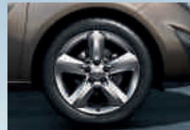
4 Leichtmetallrad 7 J x 17 im 5-Speichen-Design, Reifen 225/45 R 17