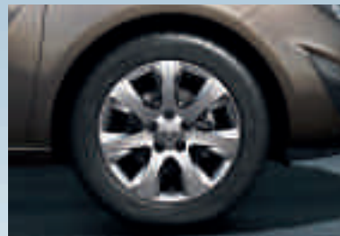
3 Leichtmetallrad 6½ J x 16 im 7-Speichen-Design, Reifen 205/55 R 16