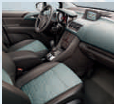
INNOVATION: Astor, Galvano Hellgrau/Morrocana 1 , Braun