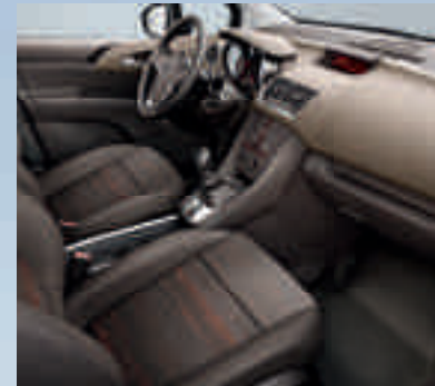
Edition: Skyline, Orange/Atlantis, Braun