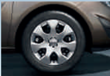
1 Stahlrad inkl. Abdeckung 6½ J x 15 und 6½ J x 16, Reifen 195/65 R 15 bzw. 205/55 R 16