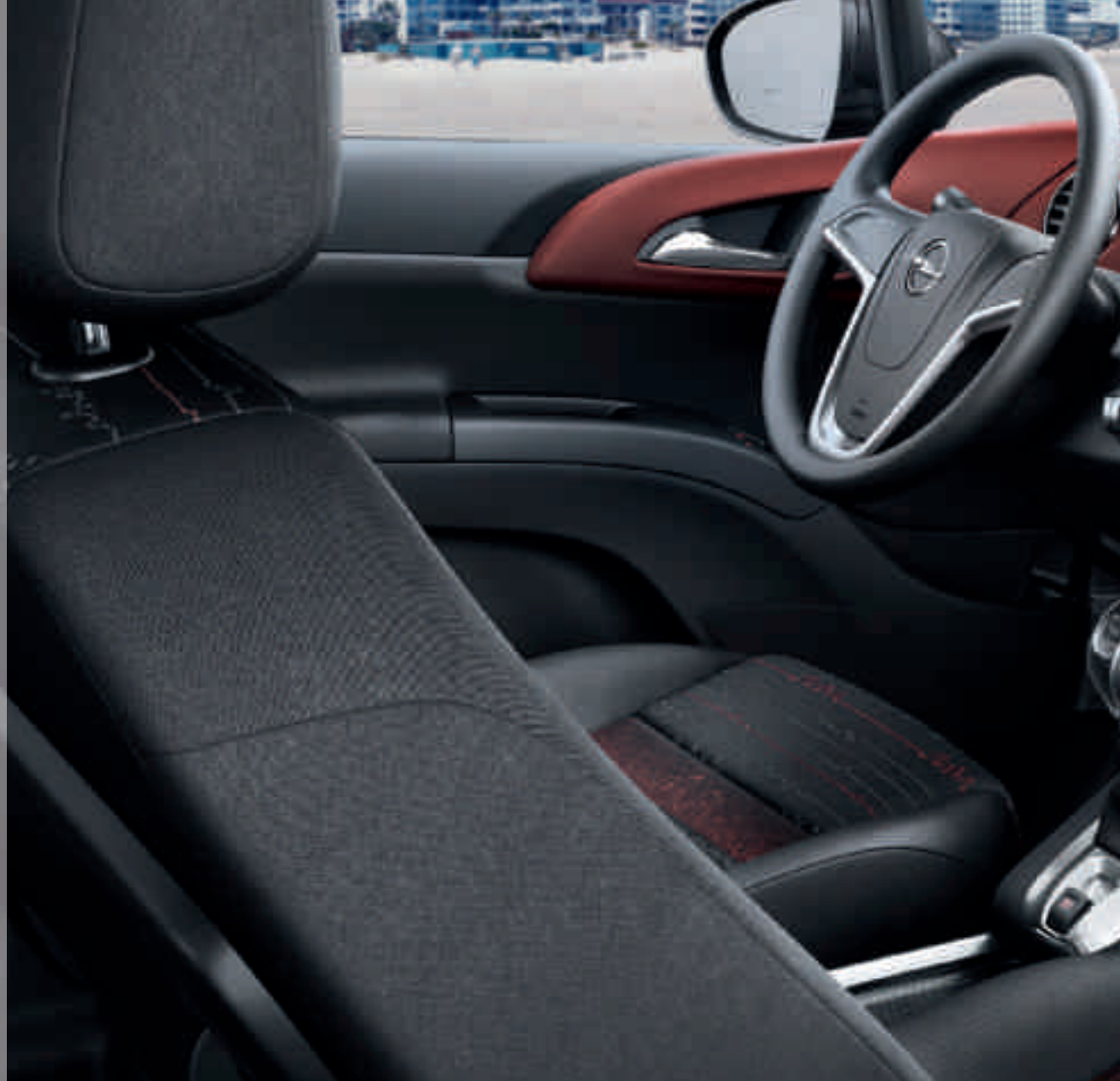
Abbildung zeigt Sonderausstattung.