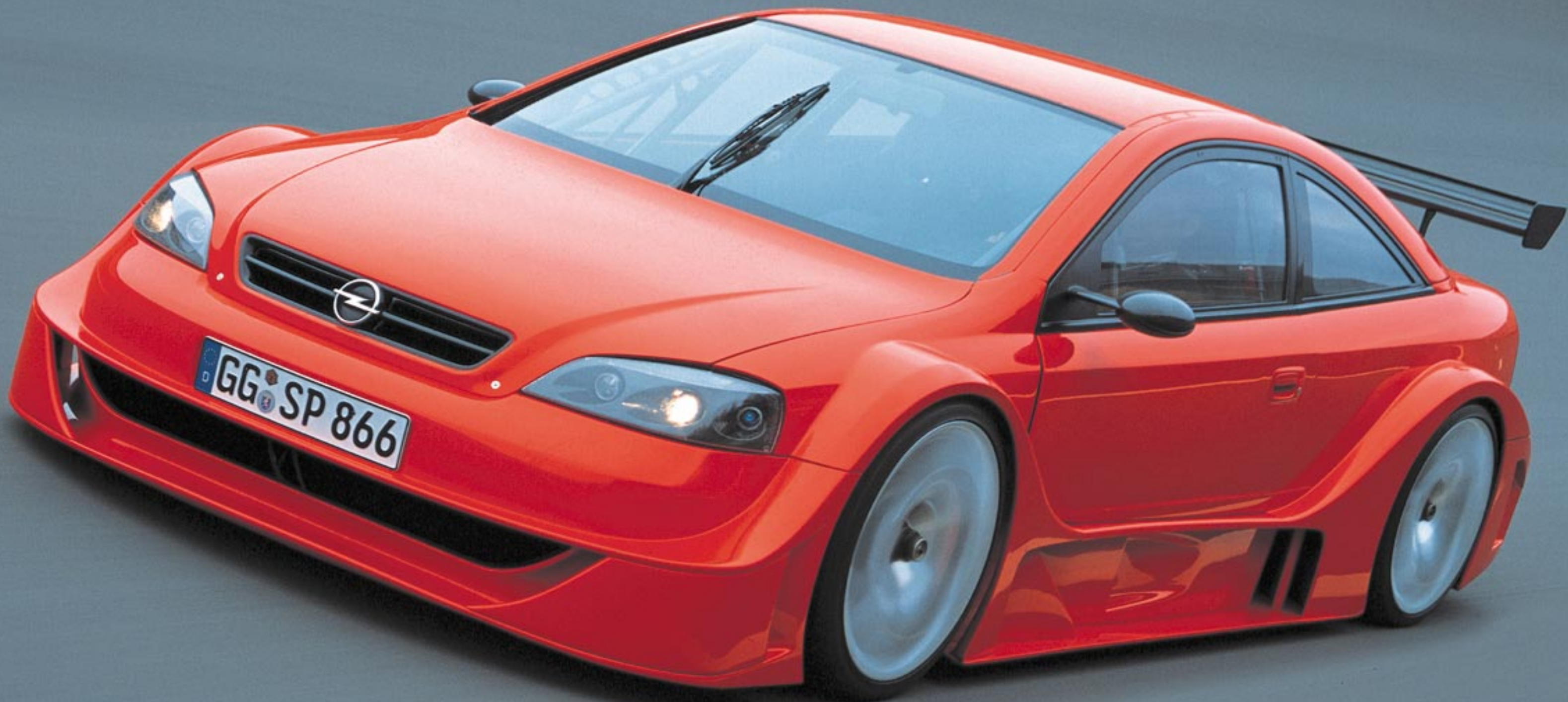
Astra OPC X-Treme