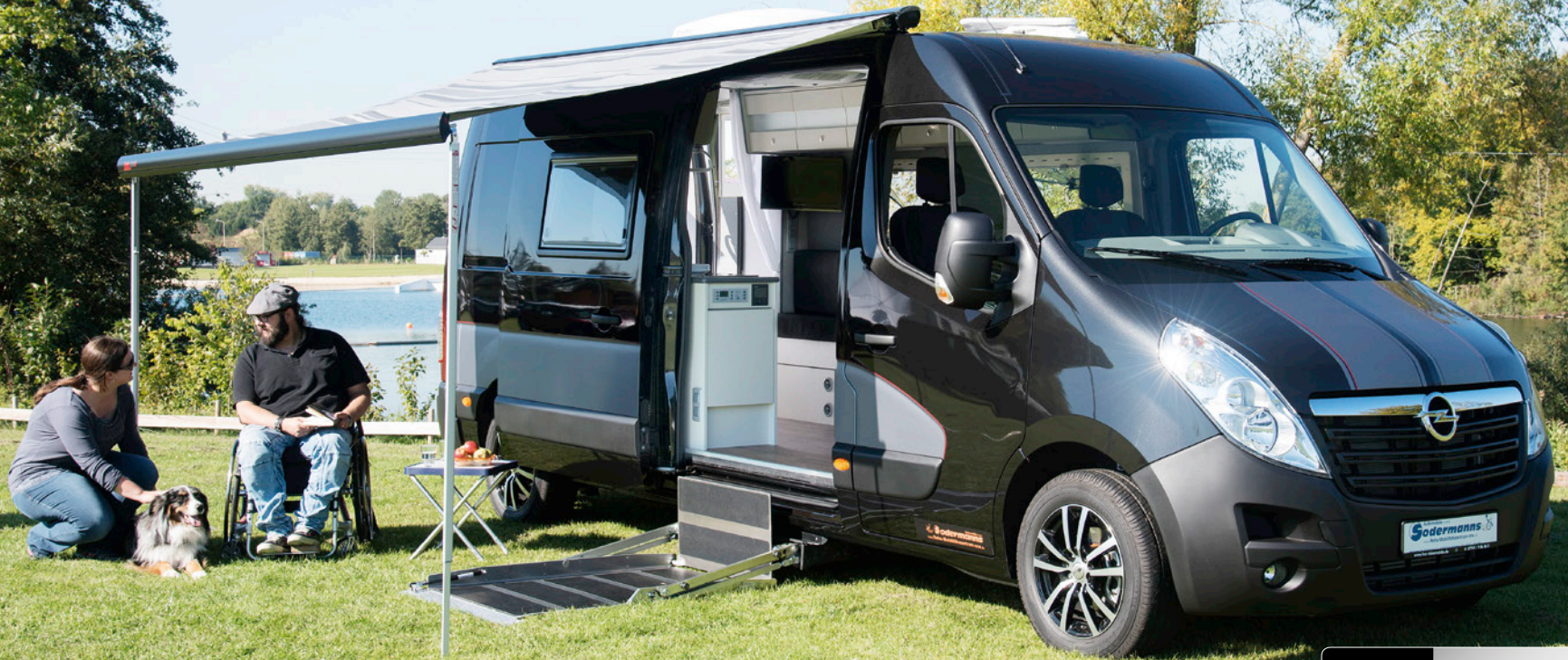
Abb. zeigt Sonderausstattungen.