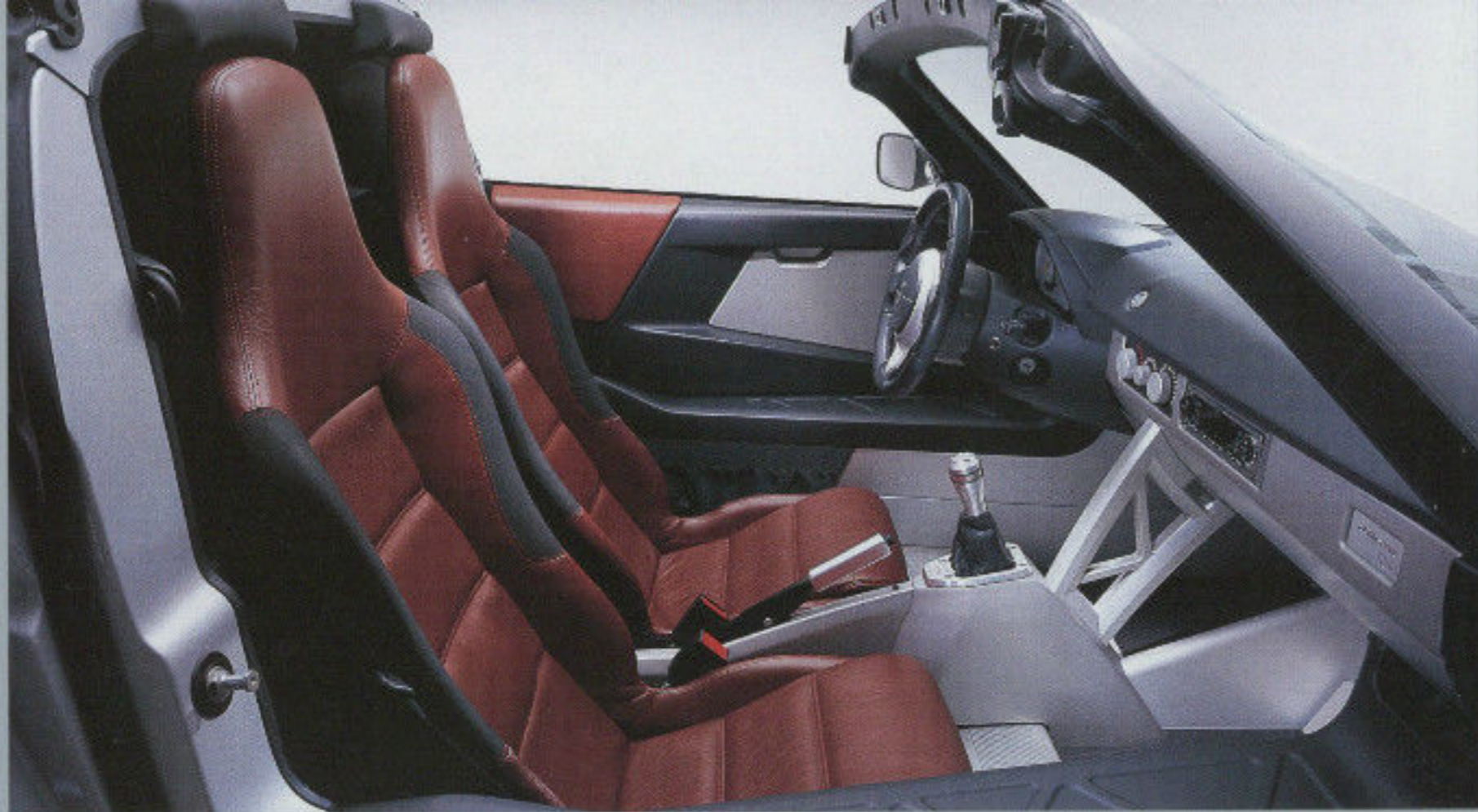
Alfa-Poker Interieur als Zubehör; Lederitze und Audiosystem sind Sonderausstattung.