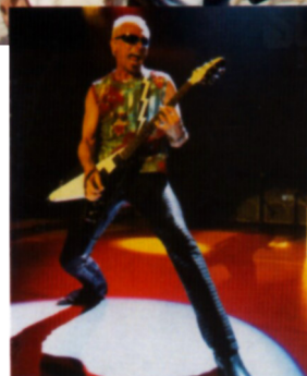
Rudolf Schenker, der Turbo unter den Gitarristen.

Die Gitarre, die Sie zusammen mit Ihrem Opel Scorpions Speedster in Empfang nehmen, hat selbst Geschichte geschrieben. Bei zahlreichen Live- und Studioeinsätzen auf der ganzen Welt.