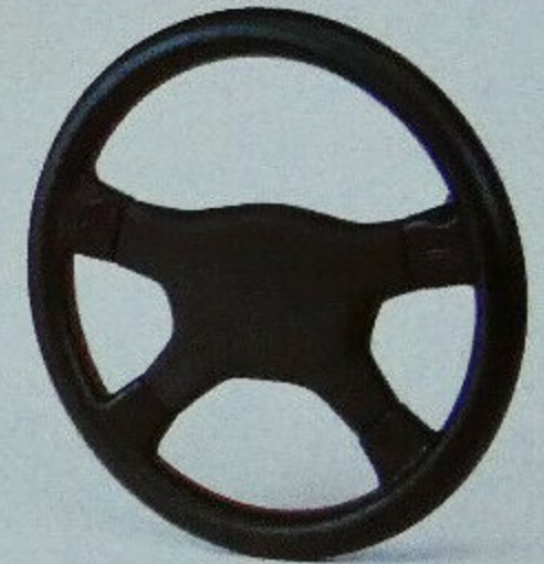
VI-02 4-Speichen-Lederlenkrad mit Sensor-Huptasten.

Der Inhalt entspricht dem Stand bei Drucklegung. Druckfarben geben den wirklichen Farbton nur annähernd wieder. Änderungen in Technik und Ausstattung sind vorbehalten. Gezeigte Sonderausstattungen gegen Mehrpreis. IRMSCHER GmbH, Bahnhof-/Pappelstraße, D-7064 Remshalden-Grünbach, Telefon 0 71 51/70 02-0.