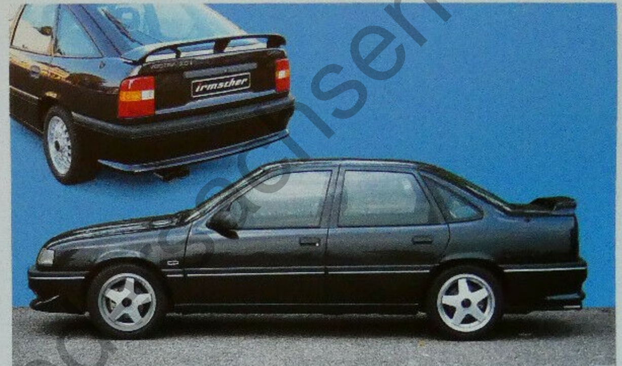
Irmischer Vectra Venice Karosseriebausatz für Vectra Fließheck (VJ-02) und Vectra Stufenheck (VJ-01).