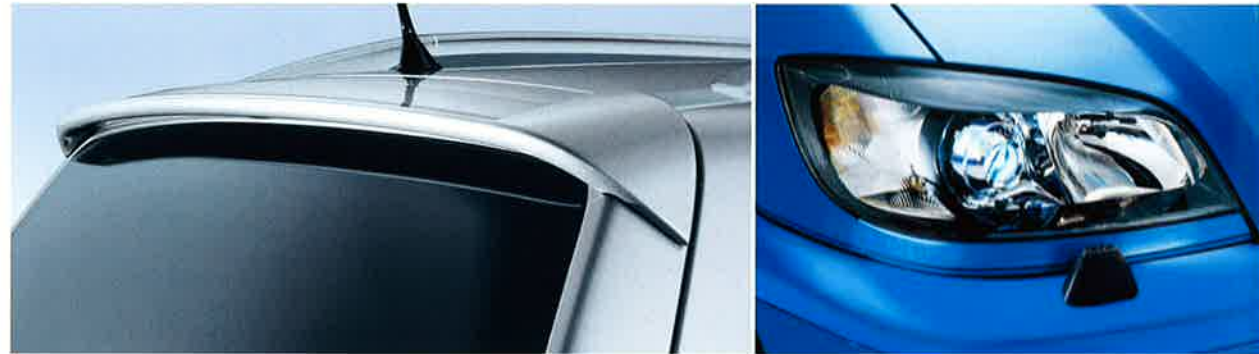
Dachspoiler und silberfarbene Dachreling

Entertainment-System „AutoVision“ für Fondpassagiere und die Telefonfreisprecheinrichtung Siemens Professional Voice. Mit dieser optional erhältlichen Ausstattung und vier exklusiven Lackierungen lässt sich die Performance des Zafira OPC nach Wunsch akzentuieren.