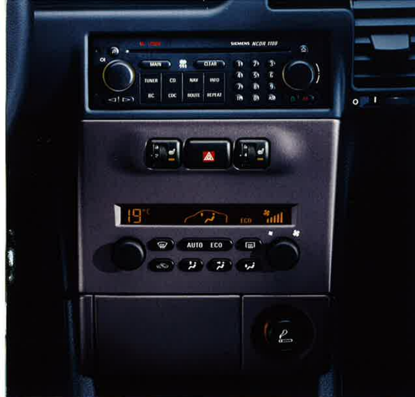
Mittelkonsole in Charcoal Metallic.