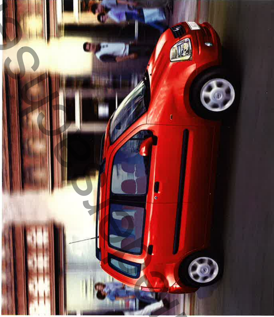
Heiße Farbe: der Agila Color Edition in Magmarot (Sonderausstattung) mit farblich harmonisch angepasstem Innenraum.

Information über Kraftstoffverbrauch und CO 2 -Emission gemäß EU-Richtlinie 1999/94 EG Kraftstoffverbrauch Agila Color Edition insgesamt 6,5 l/100 km, CO 2 -Emissionen 156 g/km