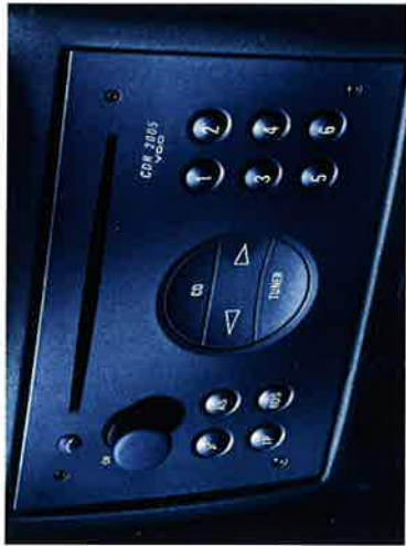
2 in 1: Das CDR 2005 vereint Radio und CD-Player. Mit 4 x 20 Watt kosten Sie digitalen Raumklang voll aus!