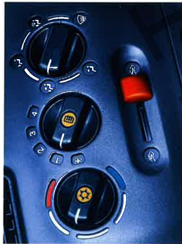
Cool: die serienmäßige FCKW-freie Klimaanlage. Der in Wagenfarbe lackierte Umluftregler beweist Liebe zum Detail.