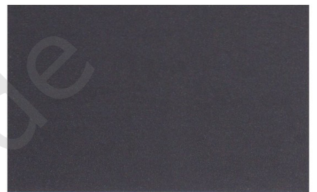
Stahlgrau Metallic (Code 49)