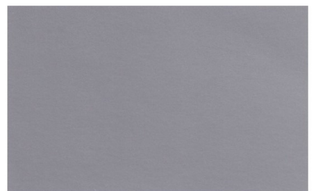
Platinsilber Metallic (Code 92)

Eventuelle Farbabweichungen der Abbildungen gegenüber den Originalfarben sind drucktechnisch bedingt. Alle Metallic- und Mineral-Effekt-Farben gegen Aufpreis.