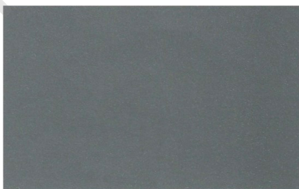
Jagdgrün Mineral-Effekt (Code 63)