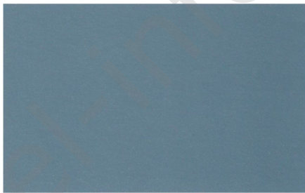
Stahlblau Metallic (Code 23)